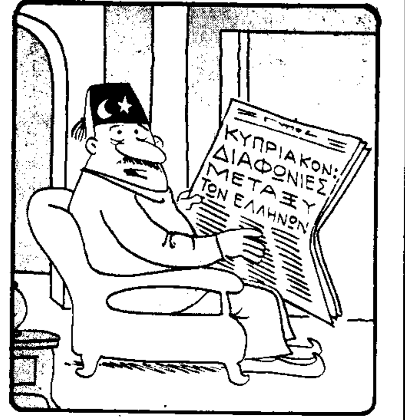
— Άλλάξ, Άλλάξ! Κόνα πρωί θα πέθκει απ' τη γαρά μου!...