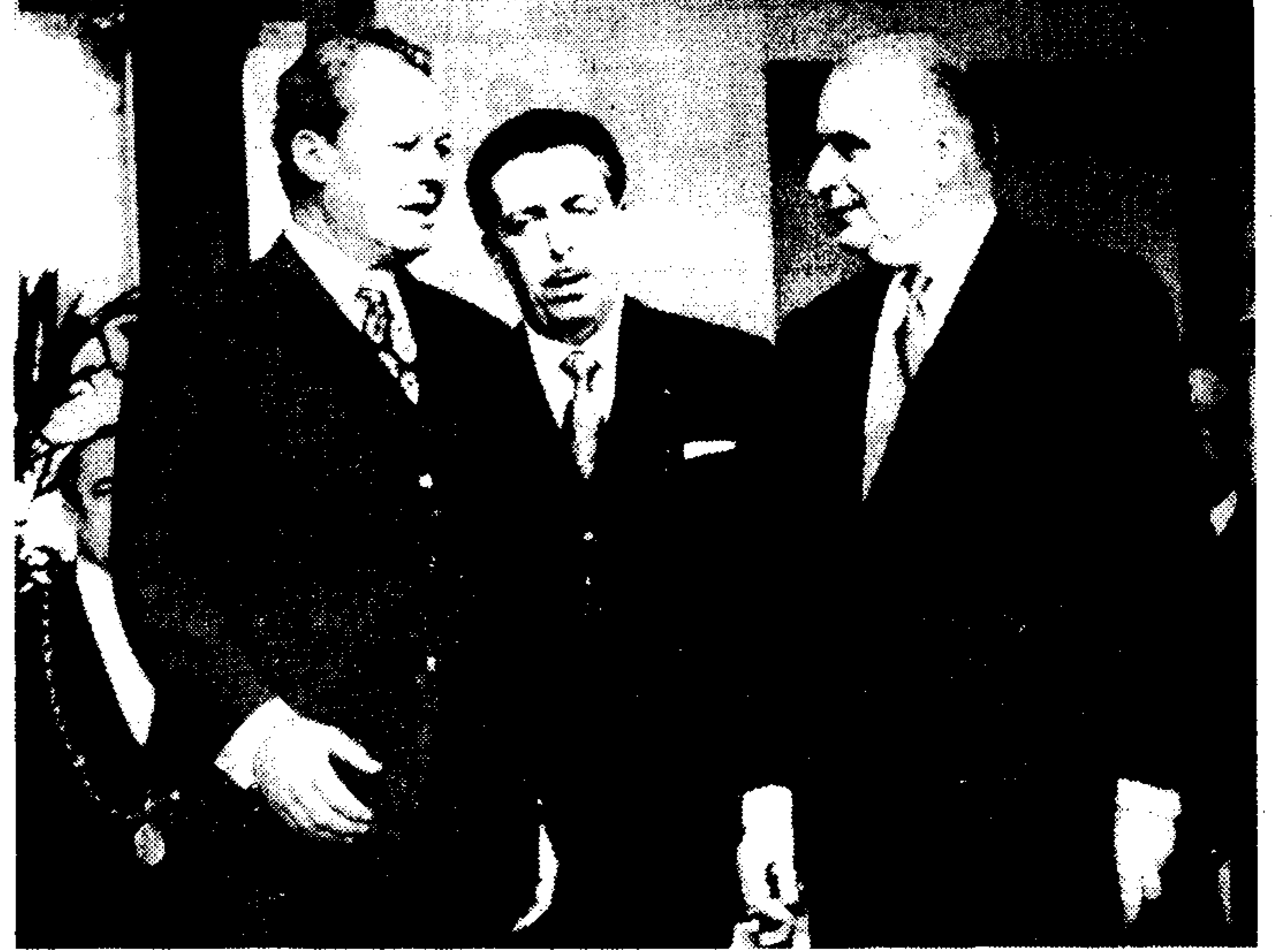
ΣΤΟ ΠΑΡΙΣΙ ΑΡΧΙΣΑΝ ΟΙ ΣΥΝΑΝΤΗΣΕΙΣ ΤΩΝ ΔΥΟ ΠΡΟΕΔΡΩΝ ΚΑΙ ΚΑΝΚΕΛΛΑΡΙΩΝ ΤΩΝ ΗΜΕΡΩΝ.